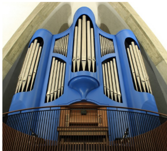
フィスクオルガン Op. 141

https://www.youtube.com/channel/UCzMmFtODyKjvFNEP5SBdKUw