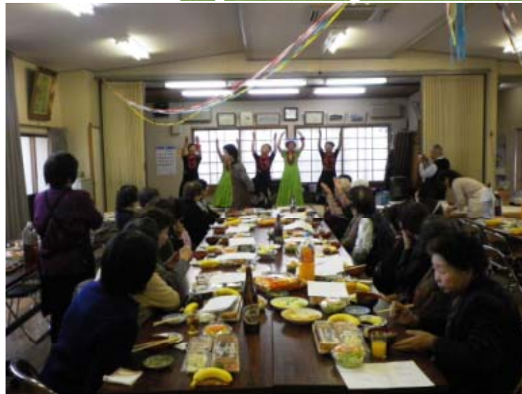
ひとりまかない 2010年12月11日